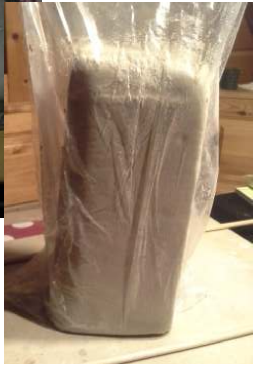
Erste Abdrucke mit Ton