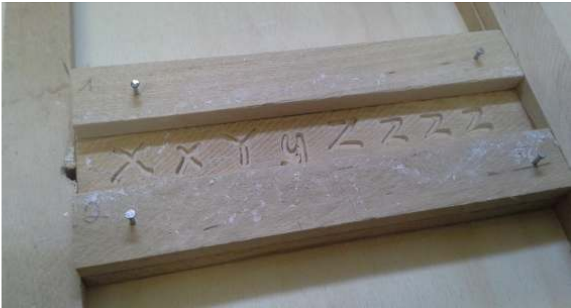
Herstellung der einzelnen Druckbuchstaben