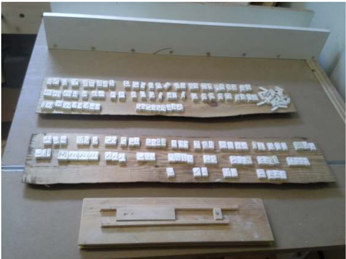
Vorrichtungsschiene zum Drucken gebaut