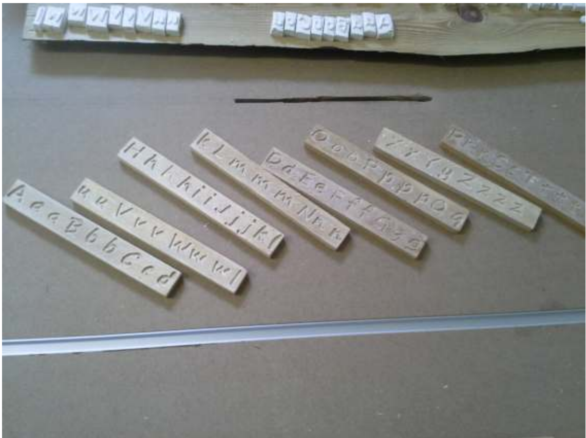
Positive, sowie negative, spiegelverkehrte Buchstaben gefräst. Erste fertige Druckbuchstaben